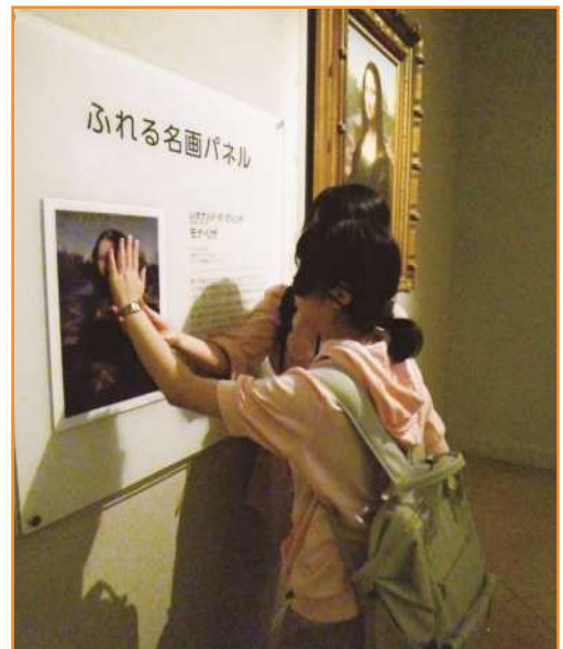
視覚障がい者も触って楽しめる絵画を体験