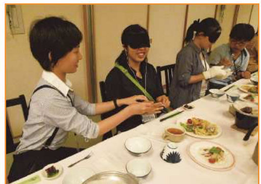
見えない・きこえない・身体の自由がきかない中での食事体験