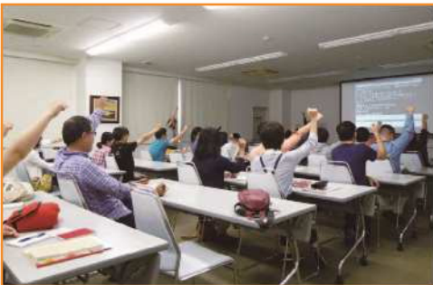
障がい学生支援室長の発声と共に結団式