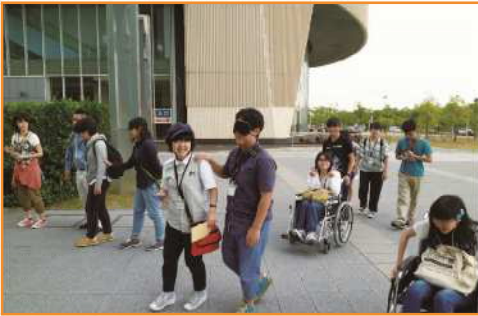
淡路島に向かう前に「人と防災未来センター」へ

3日目のクロージングでは、2日間過ごして得た気づき、今考えることを発表し合い、それぞれの考えや感情、今日までの自分自身の振り返りを共有し、互いに新たな気づきを得ることができました。