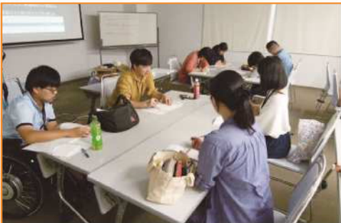
1日の体験を通してグループディスカッション